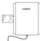
Antena Exterior Direccional SKU: PI9F