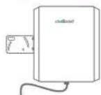
Antena Exterior Direccional SKU: P19F